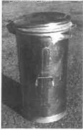
Кофа метална (тип „МЕВА“) - 110 л. Примерна снимка.

на осн.чл.2, ал.2 от ЗЗЛД във връзка с чл.42, ал.5 от ЗОП